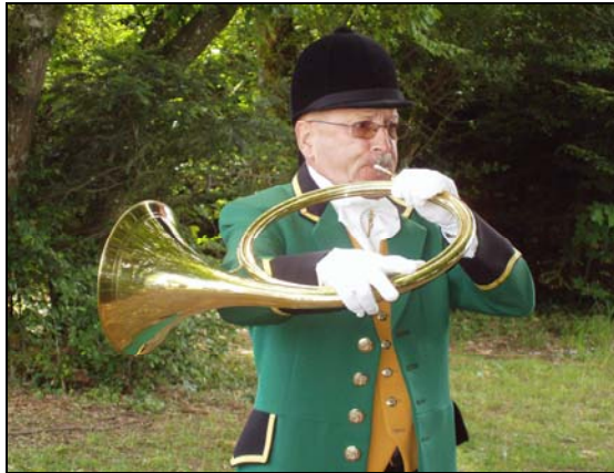
Sonneur de fanfares en pleine concentration

Le samedi fut réservé aux délibérations de l'assemblée, avec comme il se doit l'apéritif et le banquet.