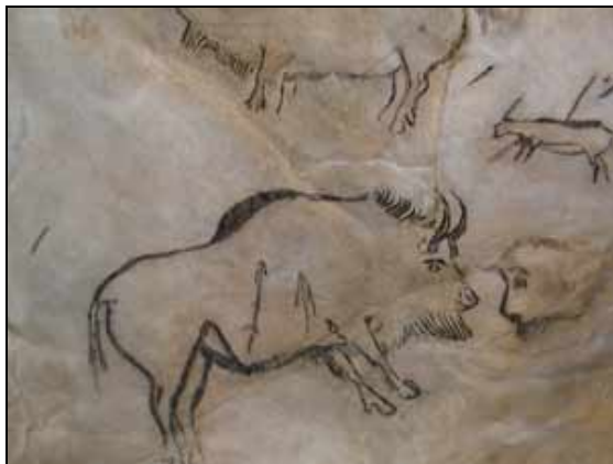
Représentation d'un bison percé de flèches faite il y a plus de 14'000 ans (Grotte de Niaux, France)

La tendance naturelle à chasser existe aussi chez un animal sociabilisé. Les affinités de prédation qu'un chat domestique met en pratique à l'encontre des souris ne sont en aucune relation avec un quelconque souci de survie. On saura aussi rallumer l'instinct de chasse sur pratiquement tous les sujets canins. Il n'en est pas autrement chez l'homme.