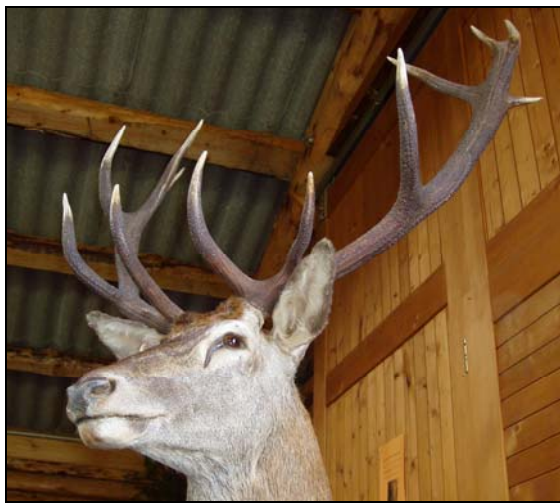
Fête de la Chasse et de la Nature 2009, Mont de Coeuve

L'idée donc d'imaginer une translocation de certains animaux surnuméraires de l'Oberland chez nous a ressurgi lors de la récente réunion des groupes de gestion du gibier dans les zones 1 (Jura bernois ouest) et 2 (Jura bernois est). Il faut dire qu'elle n'est pas nouvelle, puisqu'un groupe de travail l'avait lancée en 2002 déjà. Mais à cette époque, le cheptel bernois était encore bien modeste. Si aujourd'hui il n'est pas (encore) très important, notamment en regard des Grisons ou du Valais, il s'est solidifié au point qu'il devient déjà gênant par endroits.