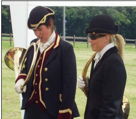
Aussi au féminin, s'il vous plaît