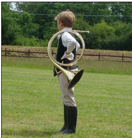
La relève est assurée

Pour le public, c'est bien le programme du dimanche qui fut le plus intéressant. Parallèlement au Championnat suisse des trompes de chasse , organisé par les Trompes St Hubert de Delémont , on y trouva de nombreuses autres animations.