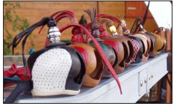
Quelques chaperons (œillères) qui ornent la tête des faucons avant la chasse

Pour le public, c'est bien le programme du dimanche qui fut le plus intéressant. Parallèlement au Championnat suisse des trompes de chasse , organisé par les Trompes St Hubert de Delémont , on y trouva de nombreuses autres animations.