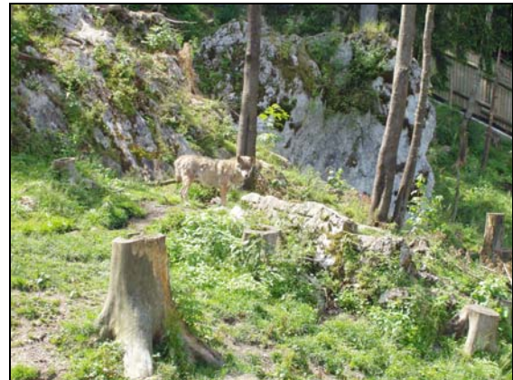
© René Kaenzig, Crémines (Mt d'Orzeires, Vallorbe)

Nous avons bien sûr un allié de taille, soit Pro Natura. L'organisation écologiste se réjouirait de revoir des loups et sait fort bien qu'il faudra des cerfs pour les nourrir.