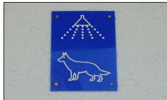
Dans un camping en Croatie

Là, nos compagnons sont aux petits soins (douche réservée aux chiens).