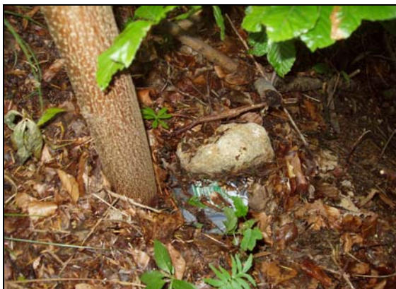
Geocache bien dissimulé