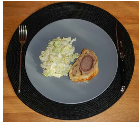
Le Filet du Mont Raimeux ... pendant ... ☺