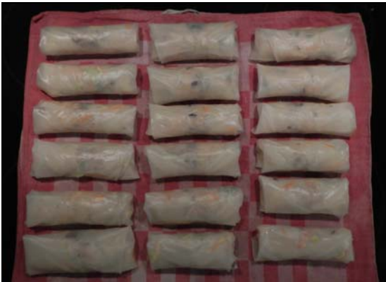
Il y en aura pour tous ...

Les Nems du Raimeux (rouleaux de printemps). Exotique? Non noon...!