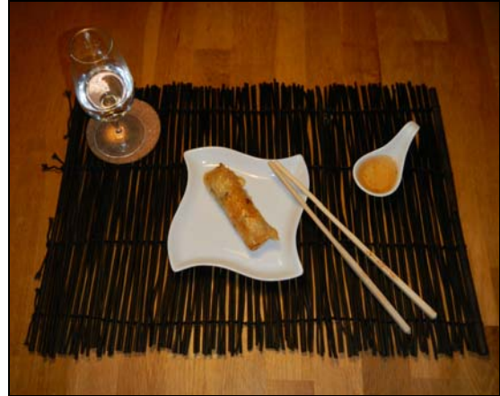
Un magnifique Nem du Raimeux (et sa gentiane!)

À la fin, ce n'est pas un verre de Saké que j'ai bu, mais ... une gentiane du Mont Raimeux !