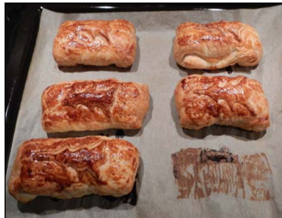
Oups! Il en manque déjà une ...

Deuxième test: en cette période festive, il fallait bien y intégrer une farce. J'ai donc tenté la Rissole du Chasseur à base d'une farce de viande de chevreuil. Accompagné d'une salade verte, ce fut un délice assuré.