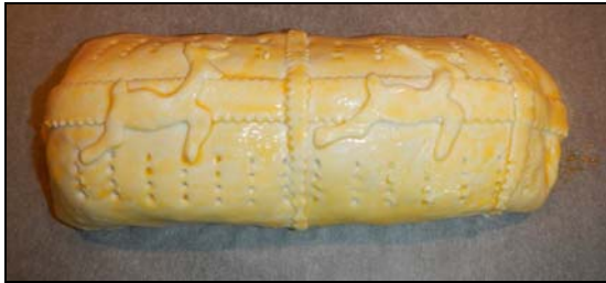
Le Filet du Mont Raimeux ... avant de passer au four

Comme la dénomination de Filet Wellington est déjà réservée pour le filet de bœuf en croûte, ben ... j'ai donc inventé le Filet du Mont Raimeux pour la variante avec le filet de chevreuil. Un filet enrobé d'une farce avec chair à saucisse et morilles (du Raimeux bien entendu) dans une pâte feuilletée ... ce fut tout simplement magnifique!