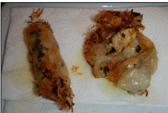
Même ceux qui explosent dans la friteuse sont excellents!