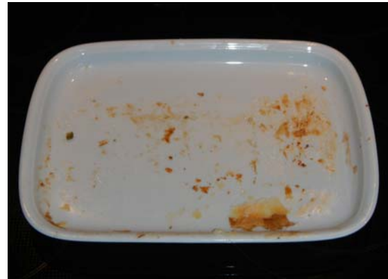
Le Filet du Mont Raimeux ... juste après ... ☺