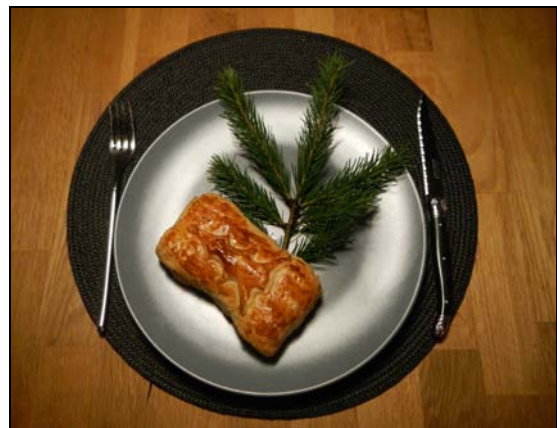
La Rissole du Chasseur avec sa brisée bien entendu