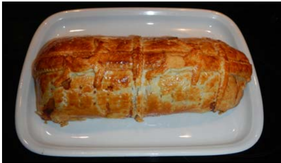
Le Filet du Mont Raimeux ... au sortir du four ☺