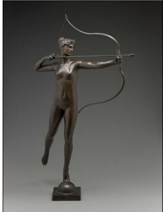
Représentation de Diane de 1895 exposée au Musée d'Art d'Indianapolis (Indiana/USA)

geonne, elle courait les forêts. Diane appartient au monde sauvage. Elle mène sa meute et pousse facilement de la voix. Ses flèches sont toujours précises, foudroyantes, rapides et mortelles.