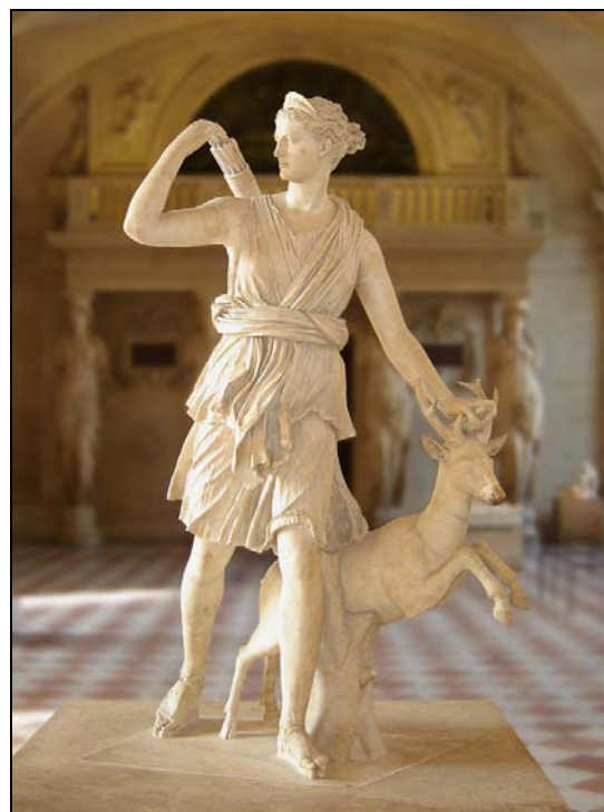
Représentation de Diane du IV ème siècle av. J.C. exposée au Musée du Louvre (Paris/FR)

Initialement on retrouve Diane dans la mythologie romaine, mais son origine nous arrive tout droit de la mythologie grecque sous le nom d' Artémis . Elle est la fille de Zeus et de Léto . Artémis est aussi la sœur d' Apollon . Des noms que nous avons déjà tous entendu mais dont nous ne connaissons pas les relations.