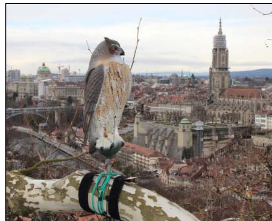
Le hibou grand-duc surveille la capitale helvétique