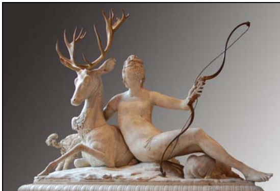
Représentation de Diane de 1552 exposée au Musée du Louvre (Paris/FR)

La déesse Diane de la mythologie romaine hérite de l'histoire de son homologue grecque. Les deux histoires sont similaires, les noms grecs sont romanisés. Diane est la fille de Jupiter (équivalent de Zeus chez les Grecs) et de Latone ( Léto chez les Grecs).