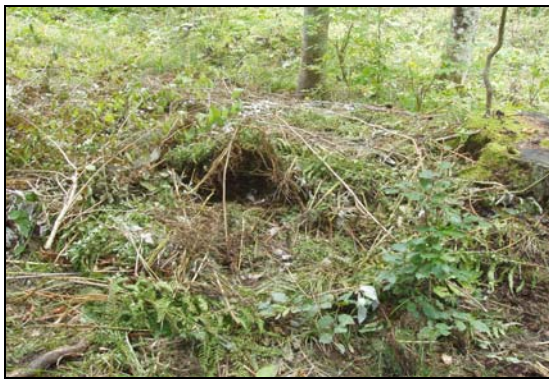
Chaudron d'un sanglier (nid de mise bas d'une laie)

Une fois la trace trouvée, on cherche rapidement à identifier l'animal. En fonction de sa forme, de sa taille, de son usure, de sa position et de bien d'autres paramètres, la trace révèle une histoire. C'est en jouant à observer, à lire, à chercher et à comprendre que chacun peut devenir un ichnologue.