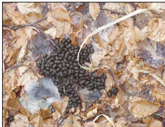
Laissées d'un chevreuil

Pour le chasseur, la recherche et la découverte d'un indice de présence est la démarche ichnologique de base. Pour nous c'est un réflexe, un automatisme.