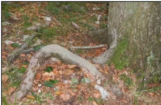
Dépôt de terre laissé par le frottement sur la racine d'un sanglier (houzure)

L'ichnologie propose donc un mode original de lecture de notre environnement. Elle devient un outil d'apprentissage par l'observation s'appuyant sur une démarche scientifique.