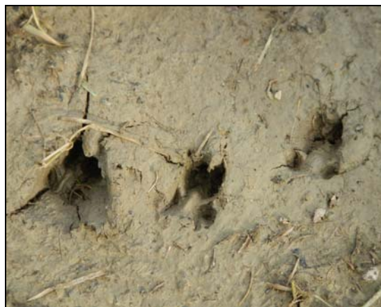
Empreintes de chevreuils