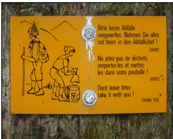
... et pourtant.