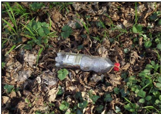
... visiblement, la bouteille pleine n'était pas lourde à porter ... mais la bouteille vide l'était ...