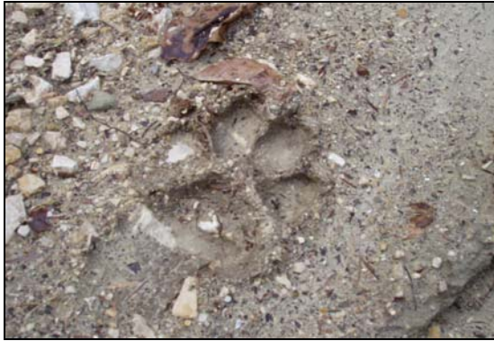
Empreinte d'un lynx

Une fois la trace trouvée, on cherche rapidement à identifier l'animal. En fonction de sa forme, de sa taille, de son usure, de sa position et de bien d'autres paramètres, la trace révèle une histoire. C'est en jouant à observer, à lire, à chercher et à comprendre que chacun peut devenir un ichnologue.