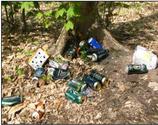
... ici la fête était belle ... pour certains ...