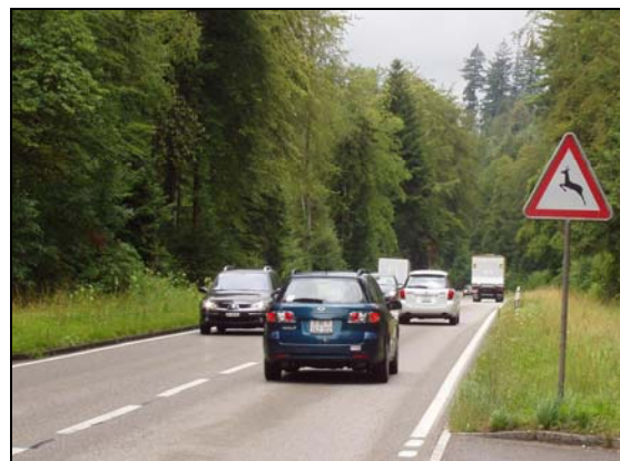
Längwald et l'axe entre Aarwangen et Niederbipp