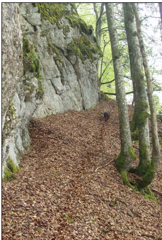
La montée sous les falaises de La Haute Joux

Sous la falaise on se demande vraiment si celle-ci est franchissable sans escalade au travers des rochers. La flèche bleue furtive nous indique la voie.