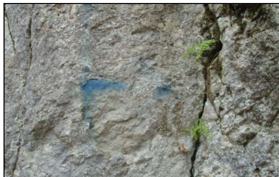
Différents marquages tout au long de l'ascension