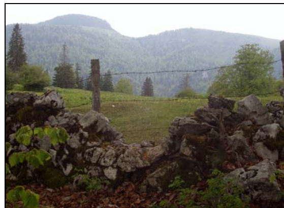
Sortie de l'escalade au travers des falaises de La Haute Joux pour se retrouver à 50 mètres de la cabane du Backi en face de la Hasenmatt (à gauche) et la Stallflue

L'arrivée au sommet est très discrète. Même planté sur le lieu précis de l'arrivée du sentier furtif, on n'y découvre aucun indice qui laisse présager son existence. Le vrai " Sentier des Brigands ".