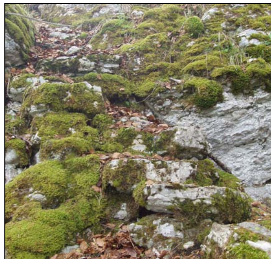
Escaliers de fortune pour franchir le derniers pas

retrouvons sur le pâturage du Backi à quelques 50 mètres de la cabane.