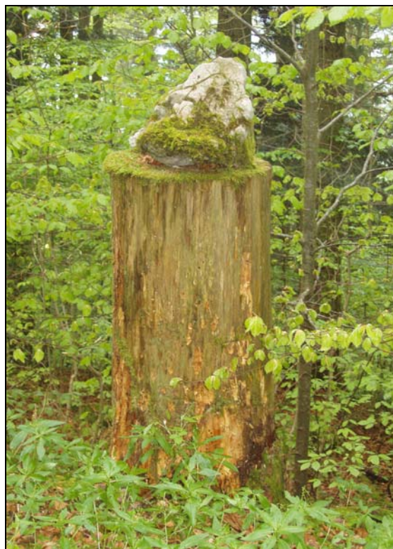
Marquage du début de la montée par un cairn original

mais avec l'âge, il a perdu de sa visibilité. Le balisage n'est pas à confondre avec le marquage des forestiers. Aux pieds des falaises, on devine également un signe bleu indiquant la direction à suivre pour franchir le dernier grand obstacle.