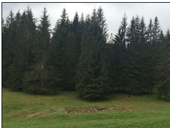
La "Piscine du Mont Raimeux"

Revenons un peu sur notre passé en le mettant au présent. Le promeneur attentif aura vraisemblablement remarqué l'étrange dispersion de pierres calcaires, qui semble bien ordonnée pour un tel endroit, aux abords du sentier du Pâturage Dessus qui relie le Raimeux de Grandval au Raimeux de Crémines en passant par Sur le Golat (voir dessin ci-après).