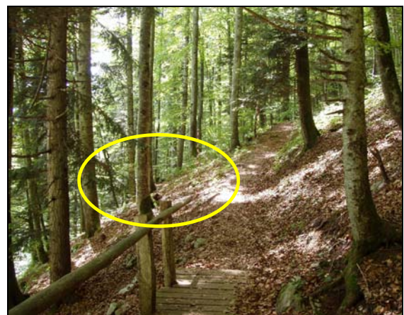
Emplacement prévu de la plateforme Faune et Chasse

En l'an 1800 s'achève le temps des privilèges seigneuriaux. Les premières lois cantonales furent édictées et c'est en 1875 que la première loi nationale sur la chasse fut adoptée.