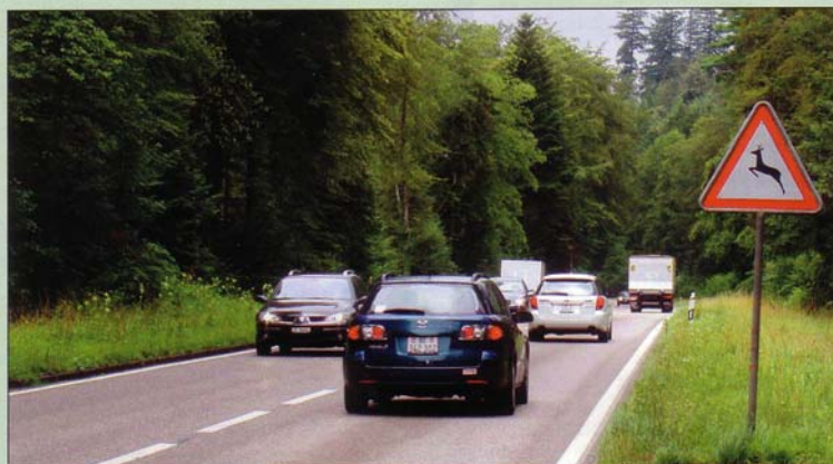
Längwald et l'axe entre Aarwangen et Niederbipp .