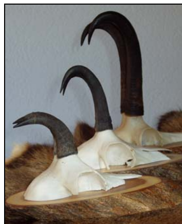
Mes trois premiers chamois de 2002

Pour avoir fait ce tir sélectif d'élimination, j'ai reçu en retour (à l'époque uniquement) un bouton de remplacement pour la continuation de ma chasse. C'est comme cela que j'ai eu la possibilité de mettre trois chamois à mon tableau de chasse en 2002.