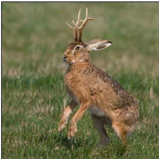
Magnifique spécimen de Jackalope

La Confrérie St Hubert du Grand-Val dispose d'une équipe scientifique qui tente depuis plusieurs années de mettre toute la lumière sur des espèces animales très discrètes, qui semblent disparues mais qui sont encore bien établies parmi nous. Cette équipe de renom et mondialement reconnue a eu la chance et l'honneur de considérablement contribuer aux divers travaux actuels et prioritaires dans le domaine de la cryptozoologie. On se souvient des progrès incommensurables faits sur le dossier concernant l'étendue du Dahu en Europe avec toutes ses déclinaisons. On se souvient également encore très bien de la course poursuite de l'an passé sur l' Almasty qui avait résidé dans notre Grand-Val . Le dossier du Péryton est actuellement en veilleuse en raison du manque de nouveaux indices de présence disponibles.