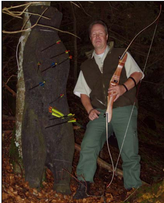
Confrontation entre deux ours

Si l'on passe dans le sport de compétition, dans la même catégorie des arcs à doubles courbures ( Recurve ), cela devient un peu plus sophistiqué. L'engin étant déjà plus grand, il sera équipé de stabilisateurs, de viseurs, d'amortisseurs de chocs et bien d'autres gadgets.