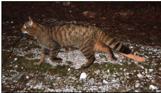
© Louis Tschanz, Perrefitte (Chat sauvage)

Dans les relations professionnelles on parle d'endurance, d'ambition, de détermination, d'assiduité et de patience... et autres. Dans la pratique de la chasse il en va de même, seuls ceux qui se préoccupent vraiment du sujet, qui se forment continuellement et qui observent la nature ont du succès et, plus encore, du plaisir à la chasse.