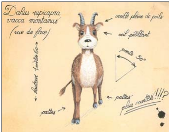
Très vieille planche d'un Dahu Lévygyre dessinée par un scientifique dans les années 1860

Suite à un entretien très intéressant que j'ai eu avec un chasseur des Bouches-du-Rhône (F), j'ai rédigé les quelques lignes qui suivent sur un sujet des plus sérieux. Ses longues observations et multiples études sur le Dahu de Camargue , aussi parfois orthographié Dahut , m'ont littéralement bluffées. Je ne pouvais pas laisser la qualité et le détail de ses propres théories sans engager mes recherches personnelles sur le terrain. Sachant que nous avons notre propre race de Dahu , également connu dans la région jurassienne sous le nom de Dairi , la Confrérie St Hubert du Grand-Val ne pouvait pas laisser les toutes dernières découvertes scientifiques sous silence.