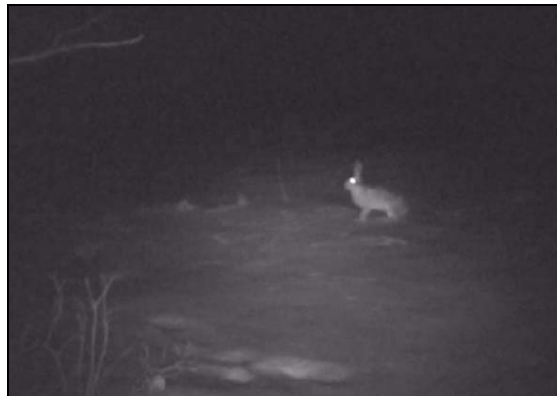
© Video IR/20.03.10, René Kaenzig, Raimeux de Crémines

Les premiers essais en infrarouge sont un peu plus périlleux et même aléatoires. L'œil nécessite un peu d'habitude et d'adaptation. Le spectacle est tout autant passionnant.