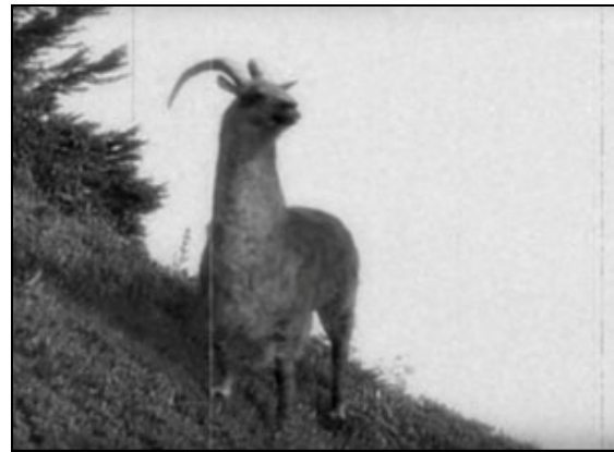
Un spécimen de Dahu Dextrogyre

Le Dahu est un animal qui ressemble fortement au bouquetin avec un poil brun-gris et une paire de cornes similaires (pour un même âge, celles-ci sont moins développées que chez le bouquetin adulte). La principale caractéristique est qu'il a deux pattes d'un même côté plus courtes que celles de l'autre. Cette "déformation" donne à l'animal un avantage certain pour circuler à flanc de montagne. Le côté où les pattes sont les plus courtes détermine le sens dans lequel le Dahu se déplace dans la montagne.