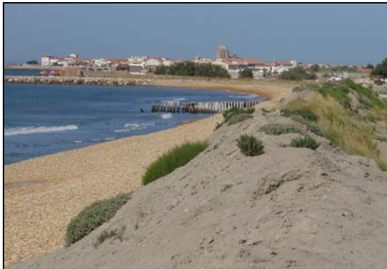
© René Kaenzig / Saintes-Maries de la Mer

L'espèce avec les pattes gauches plus courtes, donc Lévogyre , a suivi la berge gauche. L'espèce avec pattes droites courtes, donc Dextrogyre , est descendue en direction de la Mer Méditerranée par la rive droite du Rhône .