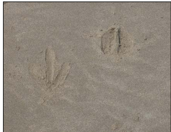
© René Kaenzig / Empreintes du Dahu de Camargue

empreintes du Dahu de Camargue . J'en suis particulièrement fier: c'est en primeur que je publie une photographie exclusive de ses traces. En regardant en détails la prise de vue, vous comprendrez aisément que c'est vraiment exclusif. Le Dahu Fluvialis Dextromareas ayant sa patte gauche constamment dans l'eau (la droite au sec sur la berge), celle-ci s'est adaptée à son environnement tout au long des millénaires. On observe même que les pattes gauches sont devenues palmées. Ainsi est né le Dahu Camargus Dextropalmus . Je n'ai malheureusement pas encore déniché la version du Dahu Camargus Lévo palmus . Je ne serai pas tranquille jusqu'au jour de ma prochaine découverte. Un petit pichet de Gris des Sables va sûrement m'en donner le courage. Prenons-le ... le pichet!