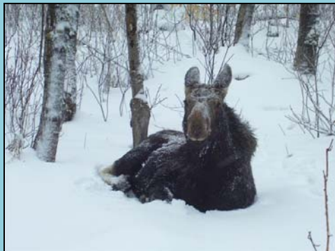
Un jeune orignal