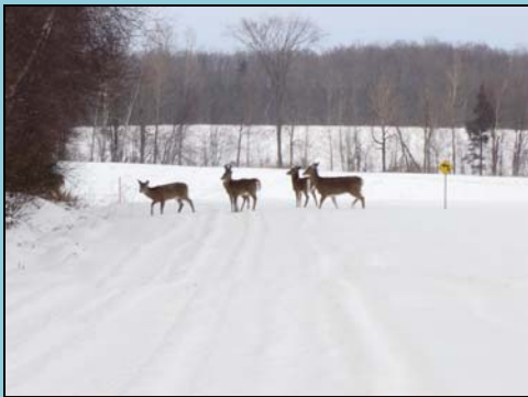
Des cerfs de Virginie sur les pistes de motoneige, ils adorent nos autoroutes de neige ... pour se déplacer sans trop de problème.

Richard Nyffeler, Compton (Québec), Canada