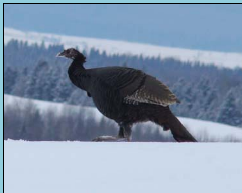
Une dinde sauvage