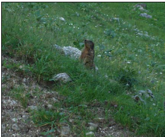
Approche sur une marmotte à moins de 3 mètres

J'ai un peu été déçu cette année par les maigres observations de chamois (cheptel en régression). Ils n'étaient tout simplement pas au rendez-vous. Mais j'ai eu un autre cadeau: la chance d'observer plus de 21 marmottes bien distinctes (comptage en 2009: 1 marmotte!). Il y en avait bien plus encore, mais n'étant pas sûr de compter certains individus à double, la consigne était claire: on ne note pas. Le cheptel est définitivement en progression.