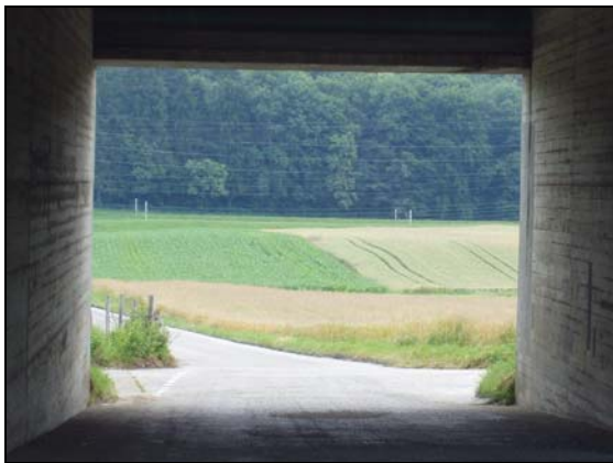
Le Längwald en arrière plan (passage sous l'A1)

J'ai passé pratiquement toutes mes vacances d'été de mon enfance chez mes grands-parents à Oberbipp (BE). Mon grand-papa avait un programme quotidien empreint d'un métronome (il faut dire qu'il avait travaillé dans l'horlogerie). Dès sa retraite, tous les jours et tout au long de l'année, et ceci par tous les temps, l'après-midi était consacré à sa promenade. Et pas n'importe quel parcours: le Längwald ! Un parcours relativement plat qui empruntait un passage sous l'autoroute (!) et un autre par-dessus la ligne ferroviaire.