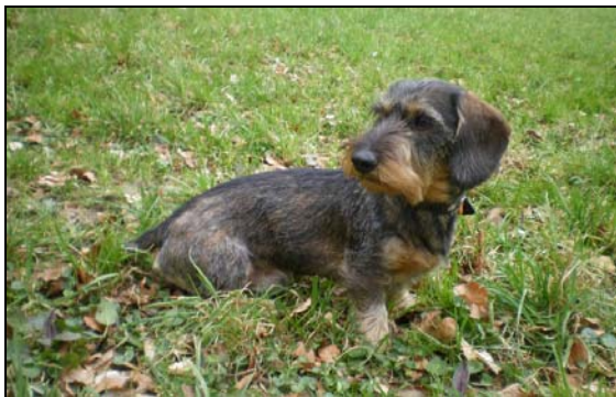
Eiko vom Hasenacker , dit "Eiko" (Teckel à poil ras, 2008)

Chenil. Hauteur 1.8 m. Surface de base pour un chien 6m 2 (chien jusqu'à 20 kg); 8m 2 (chien de 20 à 45 kg); 10m 2 (chien de plus de 45 kg).