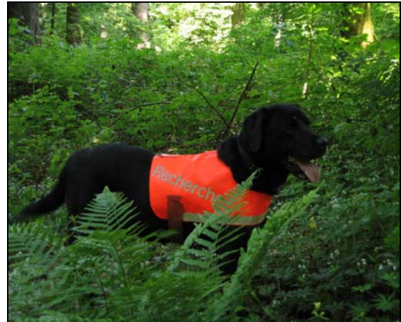
Lasco de Waterfan's-Amazing, dit "Lasco" (Labrador Retriever, 1993 – 2006)

telettes de sang sur une piste de 500 ou 1'000 mètres englobant deux angles. En fin de piste, un objet simulant l'animal blessé ou mort y est déposé. C'est à la longe que le chien sera conduit par son maître pour retrouver la fin de piste.