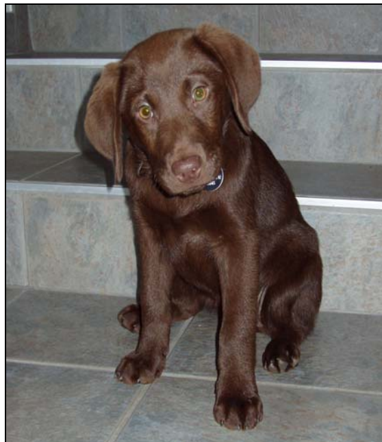
Tina Schoggi de Sous-la-Rive, dit "Tina" à 3 mois (Labrador Retriever, 2010)

La décision d'acheter un chien ne doit pas être prise à la légère. Il ne s'agit pas d'acquérir un simple objet, mais bien d'accueillir un animal qui va nous accompagner normalement pour plus de dix ans. Certaines réflexions sont nécessaires au préalable et des réponses doivent être trouvées à de multiples questions.