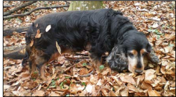
"Eika" (Cocker, 1999)

sexes différents à cause des périodes de chaleur. Les femelles sont en général plus faciles. Les mâles sont plus têtus. Il faut une main plus dure pour l'éducation.