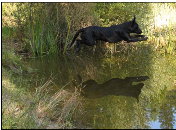
Lasco de Waterfan's-Amazing, dit "Lasco" (Labrador Retriever, 1993 – 2006)

traînes doivent se faire en forêt. Le départ de la traîne sera marqué par du poil de gibier. Ce dernier sera ensuite traîné avec une longe (ou ficelle) sur une distance d'au moins 300 mètres incluant deux angles. Le gibier sera ensuite déposé au sol à cet endroit. Tout ceci bien entendu hors de la vue du chien. Sur ordre, celui-ci devra rechercher le gibier et le rapporter au maître resté sur place au début de la traîne. L'évaluation se fait sur la façon dont le chien manifeste l'envie de chercher et de rapporter le gibier. Le chien ne passera pas l'examen s'il dévore, enterre ou déchire excessivement le gibier.