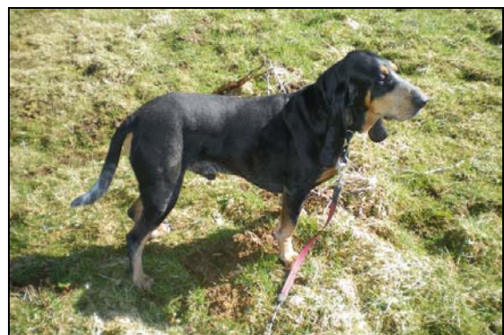
Brisco vom Spiertossen , dit "Brisco" (Chien courant lucernois, 2004)

Avec ou sans papiers: Avec! Depuis des centaines d'années, l'humain a œuvré pour sélectionner des chiens avec des spécificités et des qualités propres à chaque race. Ce qui ne veut pas dire qu'un chien sans papier ne peut pas être un bon chien!