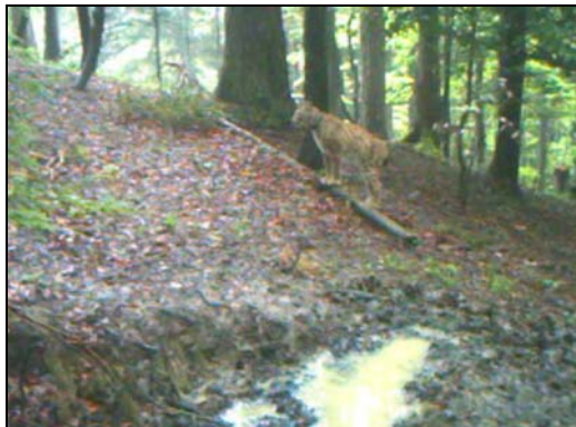
Lynx porteur d'un collier émetteur

Entretemps, la liste s'est allongée avec le passage de plusieurs lynx et d'un chat haret. Peut-être qu'on y crociera bientôt une panthère noire.