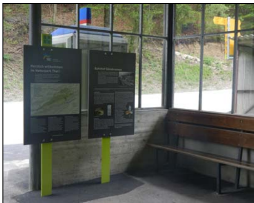
Le premier contact avec le "Naturpark Thal" se fait déjà sur le territoire de Crémines, à la gare de Gännsbrunnen

Comme déjà mentionné plus haut, une nature préservée et utilisée rationnellement est au centre du concept. La chasse fait entièrement partie de la mise en valeur des atouts de la région. Un fait rare dans certaines mentalités d'aujourd'hui.