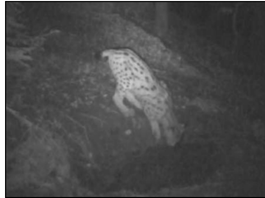
Un autre Lynx s'abreuvant dans la gouille