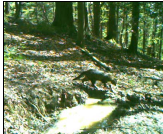
Chat haret (chat domestique retourné à l'état sauvage) à ne pas confondre avec un chat sauvage

Il est bien clair que toutes ces vidéos sont à visionner sur notre site internet.