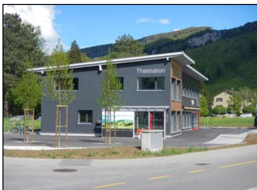
La "Thalstation", un office du tourisme directement à l'entrée de la vallée à Balsthal

Les concepteurs ont tout compris il y a plusieurs années déjà: la population "moderne" recherche une vie en symbiose avec une nature intacte et (re)mise en valeur par une utilisation rationnelle de celle-ci. Ce qui est tout à fait compatible. Ce n'est pas pour rien que la région avait accepté, il y a un peu plus d'une année, le principe d'accueillir les éventuels cerfs bernois délocalisés du Längwald . Cela faisait partie du concept.