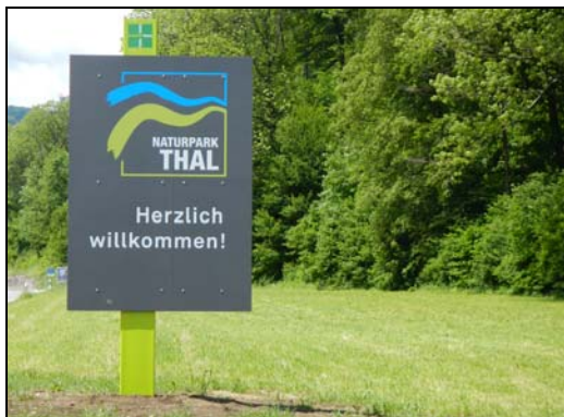
Souhaits de bienvenues à la porte de la vallée (Klus)

Les concepteurs ont tout compris il y a plusieurs années déjà: la population "moderne" recherche une vie en symbiose avec une nature intacte et (re)mise en valeur par une utilisation rationnelle de celle-ci. Ce qui est tout à fait compatible. Ce n'est pas pour rien que la région avait accepté, il y a un peu plus d'une année, le principe d'accueillir les éventuels cerfs bernois délocalisés du Längwald . Cela faisait partie du concept.