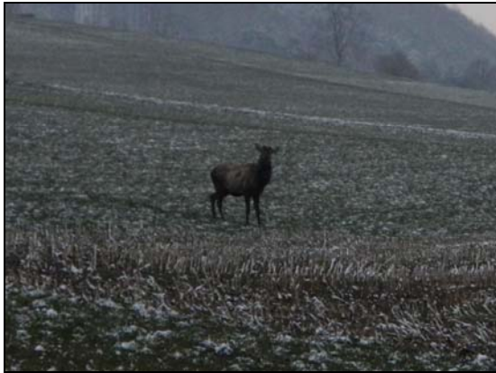
Proche des habitations à Crémises sur Le Côté