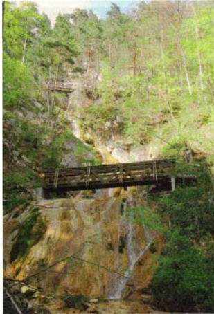
Les deux ponts qui enjambent le Gore-Virat. 100

Cinq panneaux ont ainsi été réalisés et désormais installés. Ils abordent dans les grandes lignes et de manière vulgarisée plusieurs aspects, comme la chasse et l'histoire, l'éthique de la chasse ou les animaux de la région. Il n'existe pas de cadre plus approprié pour présenter le sujet de la faune et la chasse,