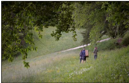
Une équipe de sauvetage en action

Le sauvetage de faons traditionnel, c'est-à-dire en parcourant le champ à pieds doit rester et restera encore longtemps une possibilité. La technologie a ses limites et ses failles, comme par exemple en cas de panne technique du drone ou de faibles contrastes thermiques. L'agriculteur peut également annoncer la fauche trop tardivement ce qui nécessite une intervention rapide sur place des bénévoles.