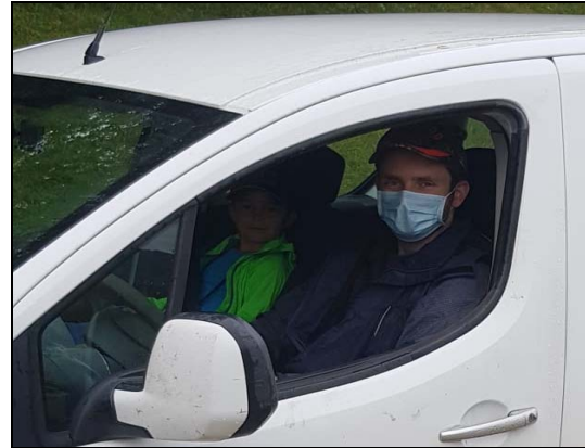
Le port obligatoire du masque dès l'âge de 12 ans

les secrets des animaux sauvages de nos forêts. Et aussitôt à l'air libre, nous pouvions à nouveau observer sans restriction les visages et les sourires des enfants.