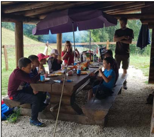
Le pique-nique de midi bien mérité