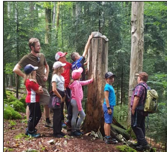
Les enfants montrent toujours un grand intérêt devant les secrets d'une saline

Les températures caniculaires n'étaient pas trop propices à une observation d'animaux sauvages pendant la journée. Quelques contacts furtifs étaient néanmoins possibles. Mais la nature nous propose tellement de secrets à découvrir, que les enfants n'ont pas eu le temps de penser à autre chose.