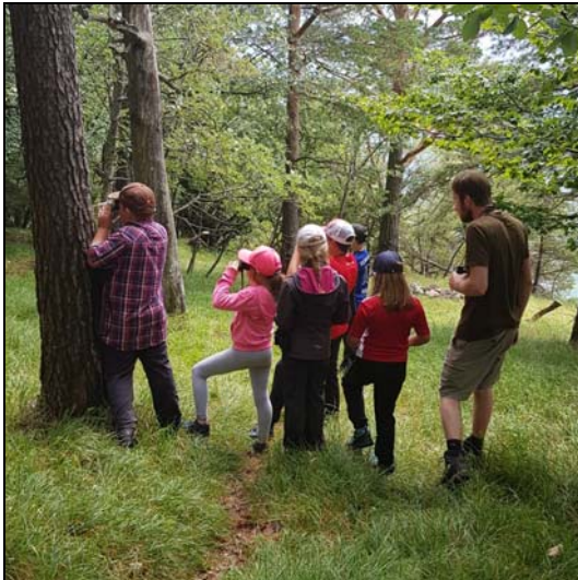
L'excitation en silence dans l'espoir de voir venir le chamois